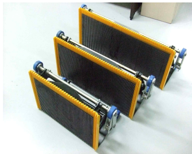
< 에스컬레이터용 스텝 >